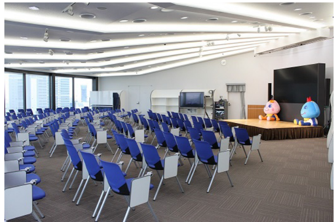
<アサコムホール内部>